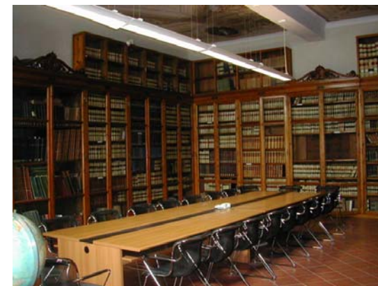
Biblioteca Centrale della Meteorologia Italiana (CRA-CMA)

Orario di apertura della Mostra Bibliografica: 16:30 - 18:30 dei giorni 28 ottobre e 3 novembre 2010