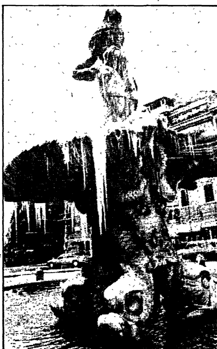
Il ghiaccio sulla fontana del Bernini di piazza Barberini